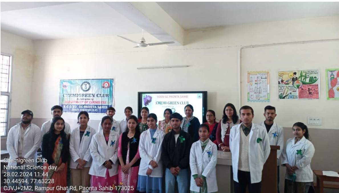
Chemigreen Club National Science day 28.02.2024 11:44 30.44594, 77.63228 CJVJ+2M2, Rampur Ghat Rd, Paonta Sahib 173025